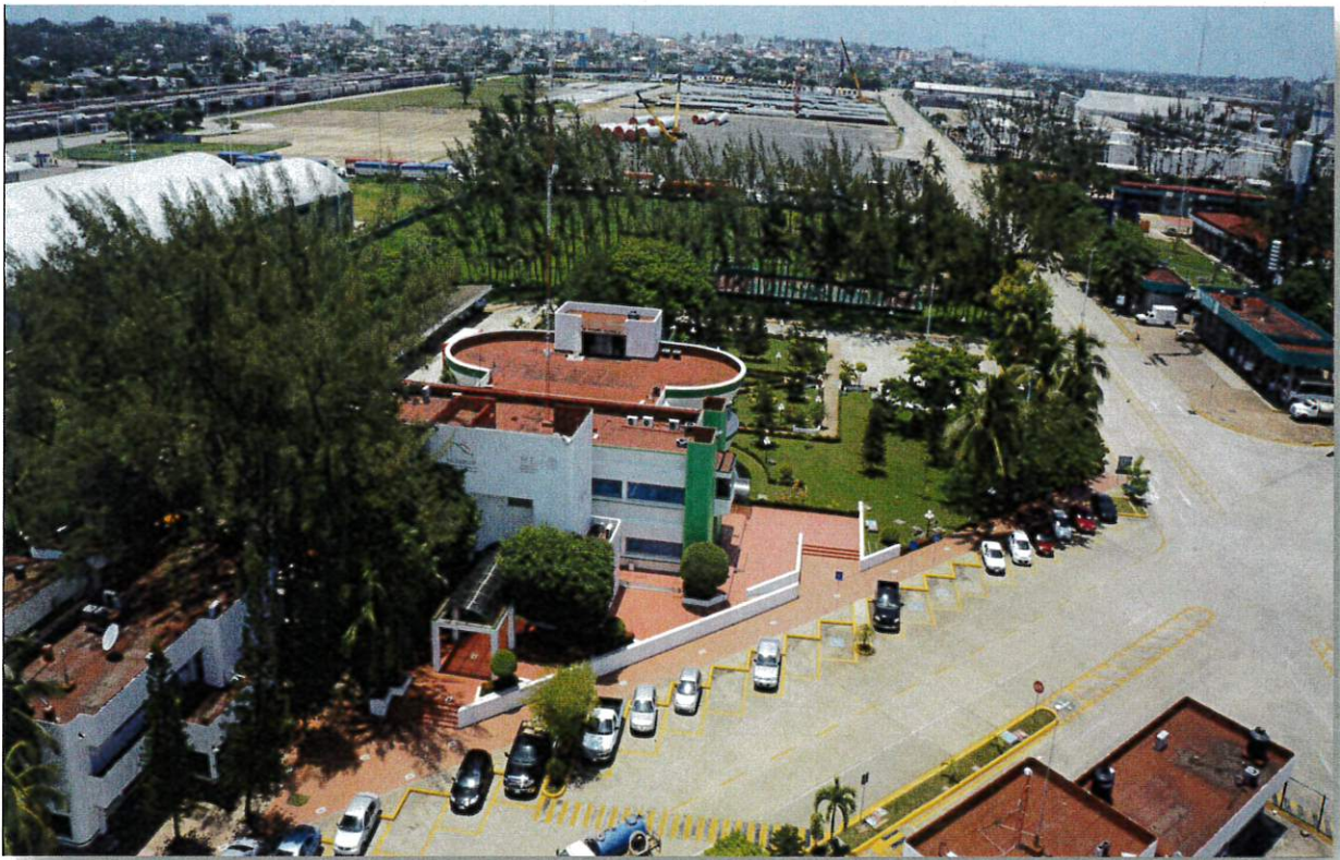
(Actualizado en la 2ª Reunión Extraordinaria del CEPCI 28/03/2018)